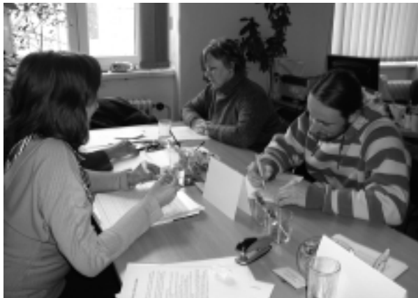
Rodičia počas zápisu.

loženou povinnou školskou dochádzkou a deti s dodatočne odloženou povinnou školskou dochádzkou,“ odpovedala riaditeľka SMŠ K. Mikulová. Podľa nového školského zákona č. 245/2008 Z. z. o výchove a vzdelávaní (školský zákon) a o zmene a doplnení niektorých zákonov a Vyhlášky MŠ SR číslo 306/2008 o materskej škole, môže byť kapacita jednej triedy pri 3 až 4-ročných deťoch: 20 detí, pri 4 až 5-ročných deťoch: 21 detí a pri predškôlkoch môže byť v jednej triede 22 detí. V každej z týchto tried musia byť po dve učiteľky. Najväčšie MŠ v Nitre sú na Zvolenskej a Beethovenovej ulici, kde je vhodné po 7 tried. Na Piaristickej je okrem 5 bežných tried, 2 špeciálne triedy pre deti s poruchami zraku, na Štiavnickej sú integrované triedy pre deti s poruchami sluchu, na Piaristickej sa špecializujú na ortoptické triedy, kam rodičia prihlasujú aj deti z okolitých obcí. (syn)