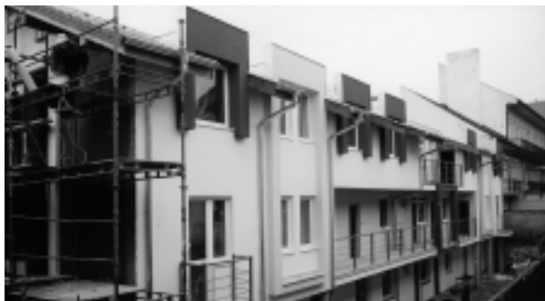
Na Ul. Fraňa Mojtu vyrástol vysokoškolský internát.